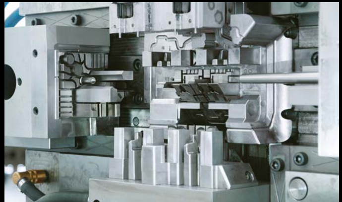
Präzisionsspritzgusswerkzeug für Eckstück Flex-Block

Das montagefreundliche Sockel-System Flex-Block für Schaltschränke wurde für und mit Rittal ( www.rittal.de ) entwickelt. Mit dem Baukastensystem können Schaltanlagenbauer gegenüber herkömmlichen Lösungen aus Stahlblech nachhaltig Montagezeit sparen. Das Sockel-System besteht aus vier Eckstücken aus glasfaserverstärktem Kunststoff, die eine Belastung von 15.000 N aufnehmen können, sowie Front- und Seitenblenden aus Stahlblech und Kunststoffeckklappen. Dank Clips-Lösungen lässt sich der Flex-Block schnell, unkompliziert und ganz ohne Werkzeug aufbauen.